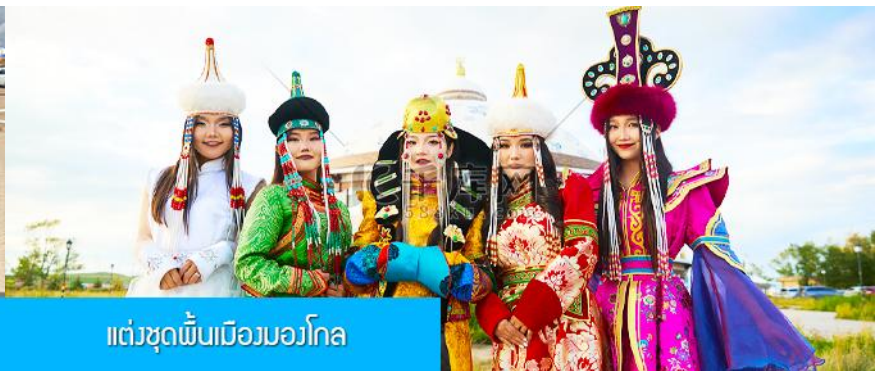
แต่งชุดพื้นเมืองมองโกล