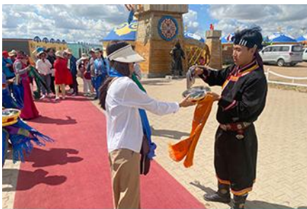
พิธีต้อนรับแขกด้วยเหล้า

รับประทานอาหารกลางวัน ณ ร้านอาหารพื้นเมืองในเขตอุทยาน (8)