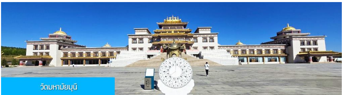
วัดมหาชัยบุรี

พักที่ YULIN CHAOYANG INTER HOTEL โรงแรมระดับ 4 ดาวท้องถิ่น หรือเทียบเท่าในเมืองหยี่หลิน