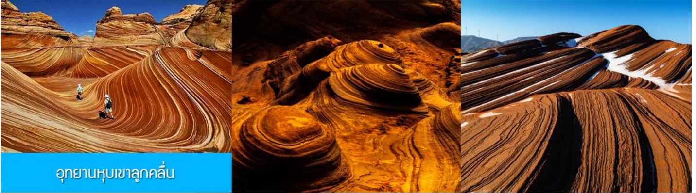
อุทยานหุบเขาลูกคลื่น