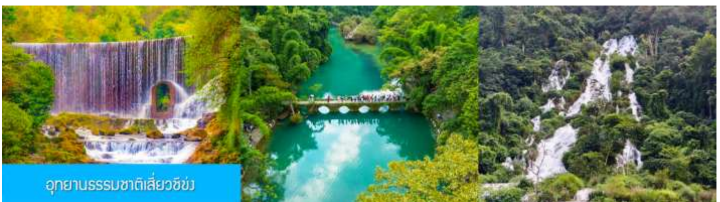
อุทยานธรรมชาติเสี่ยวชิ่ง

พักที่ DUSHAN HOLY VILLA RESORT โรงแรมระดับ 5 ดาวท้องถิ่น หรือเทียบเท่าในเมืองดูชาน