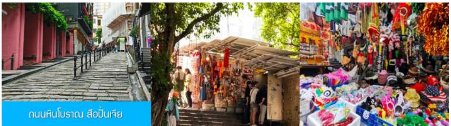
ถนนหินโบราณ สือปิ่นเจีย