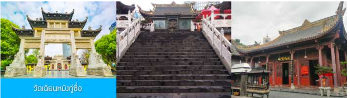
วัดเจียนหมิงกู๋ซือ