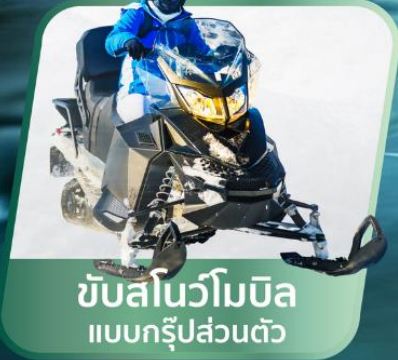
ขับสโนว์โมบิล แบบกรุปส่วนตัว