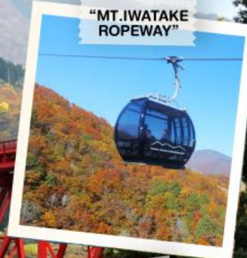
"MT. IWATAKE ROPEWAY"