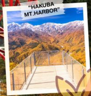
"HAKUBA MT. HARBOR"

วันเดินทาง 28 ต.ค. - 3 พ.ย. 2569 4 - 10, 11 - 17 พ.ย. 2569