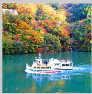
“SHOGAWA YURAN CRUISE”