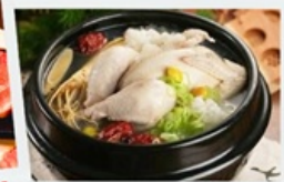
อาหารวังหลวงไก่ตุ๋นโสม