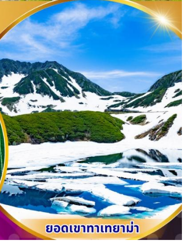
ยอดเขาทาเทยาม่า