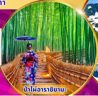
ป่าไฟ้อาราชิมะ

พิเศษ! แอ้อบเซ็น นั่งเคเบิลคาร์ ชมวิวภูเขาแอลป์