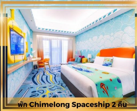
พัก Chimelong Spaceship 2 คืน

ช้อปปิ้งเดอะเวเนเชียน The Parisian The Londoner