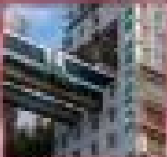
ชมตึกสูงฉงชิ่ง