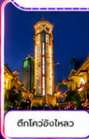
ตึกโควอชิงไหลว