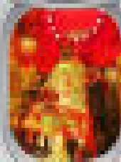
Beef with chili