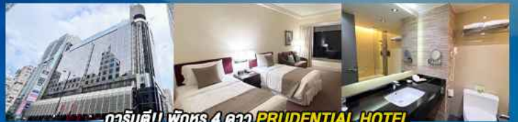
гаринดี!! พักหรู 4 ดาว PRUDENTIAL HOTEL ติดถนนนาธาน ย่านช้อปปิ้งจิมซาจуй