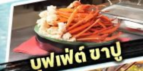
บุฟเฟต์ ขาปู