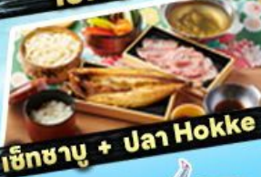
เซ็ทขามู + ปลา Hokke

ราคา เริ่มต้น 36,919 บาท รวมภาษีมูลค่าเพิ่ม 7%