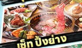
เซ็ท ปิงย่าง