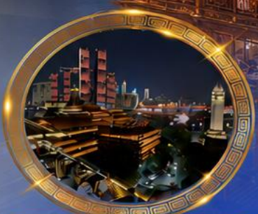
มือคำร้านอาหารวิวหลักล้าน ชมแสงสีเมืองลงชิง