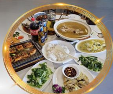
โต๊ะจีนลงชิง เมบูตันตำรับ รสจัดจ้านแท้ๆ