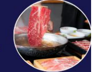
ปิ้งย่างพรีเมียม ROKKASEN เนื้อคุณภาพ