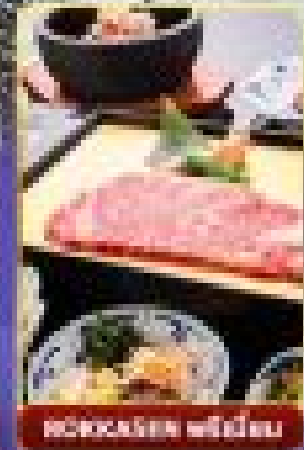
กิจกรรม สด สด สด