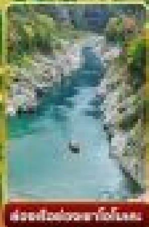
สะพานโงกุมาอิโนะ