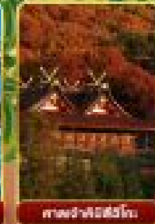
ศาลเจ้าโทชิโนะ

🍷 อาหารเช้า 4 คับ 📅 มนทระเปิด 23 ทศ x2 🌞 8Days 5Night