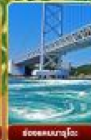
สะพานงูโจ