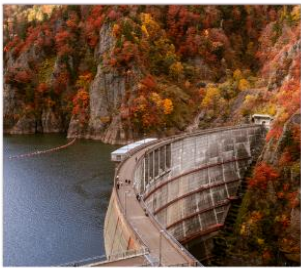
เขื่อนโฮเซเดียว