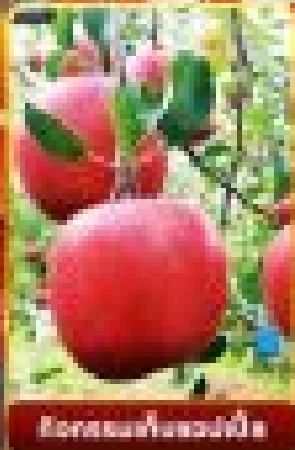
ไร่องานพีชของญี่ปุ่น