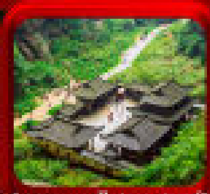
* อุทยานหลางกวง *