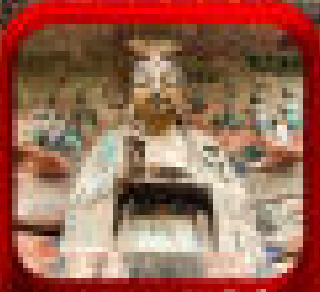
* เขานางฟ้าเมืองฉี *

ดินแดนแห่งมังกร - ถ้ำอ้อ เขานางฟ้าสะพานสวรรค์ - เขาวงกต - อุทยานหลางกวง หลางกวง - เมืองฟ้าฮกไก - ศาลาแปดเหลี่ยม (เทียนหล่ง) - สะพานผิงฮ่าว เขตรักษาพันธุ์สัตว์ป่า - สันต๋อตัน - ศิลปะ - หอศิลป์ - ศูนย์วัฒนธรรมเมืองฉี