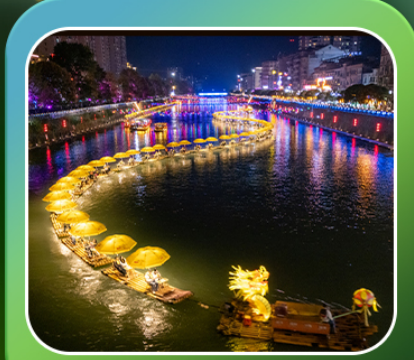
"ล่องเรือมังกรกังส่วย"