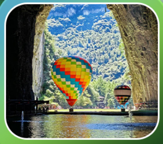
"ถ้าถึงหลง"

เที่ยวจีน 2 มณฑล เสฉวน+หูเป่ย์ (เมืองฉงชิ่ง+เมืองเอนฉือ) • ถ้าถึงหลง ล่องเรือมังกรกังส่วยชมวิวยามค่ำคืน • ผิงซานแกรนด์แคนยอน (รวมล่องเรือ) หงหยาดัง • วัดหลิวอัน • ถนนคนเดินเจียฟางเป่ย์ • ตักตะเกียบ