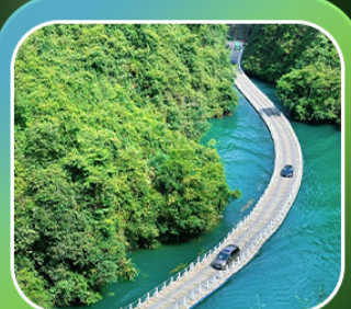
"หุบเขาสิงโต ชื่อจื่อกวน"