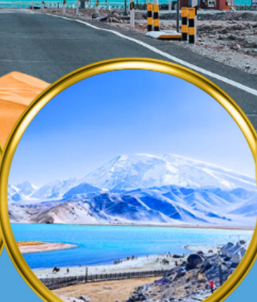
Kala Kule Lake