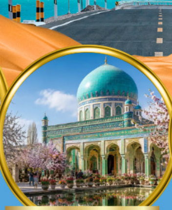
สุสานสมหอมเซียนเฟย