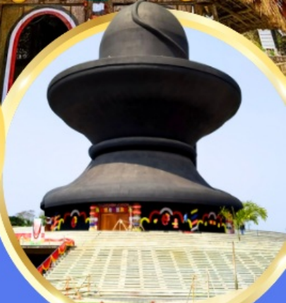
วันมหาฤตยูชัย