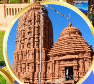
เทวาลัยศรีจักรนารท แห่งดีบุรกาห์