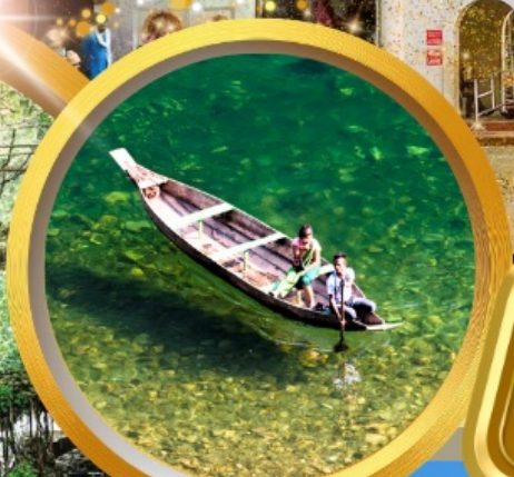
ล่องเรือทะเลแม่น้ำจุมโจต