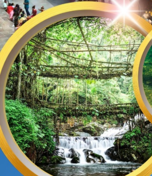
สะพานรากไม้