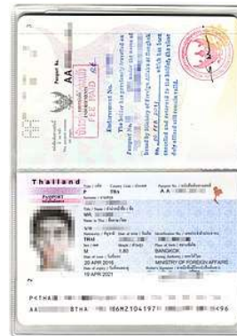
Passport เต็ม 2 หน้า