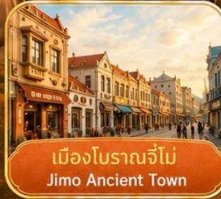
เมืองโบราณจี้โม Jimo Ancient Town