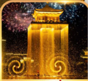
ชมโชว์อุหนี่โจว