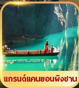
แกรนด์แคนยอนผิงชาน