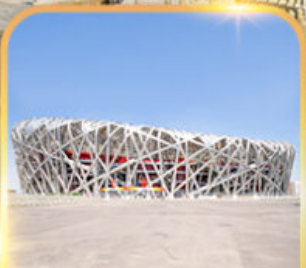
สนามกีฬาโอลิมปิก