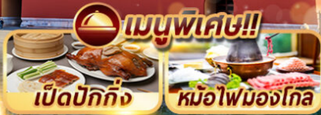
เปิดปักกิ่ง