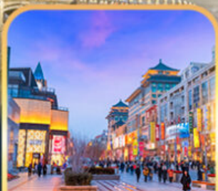
ถนนหวงฟู่จิ่ง