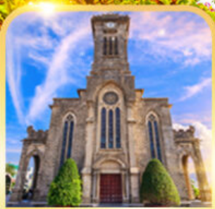
โบสถ์หินญางจาง