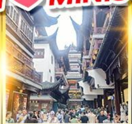
เจียงหวงเมี่ยว