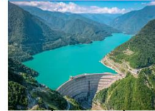
เชอนเอนกูรี