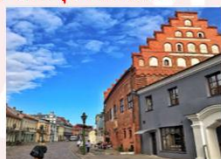
Kaunas Old Town

** พักที่ Holiday Inn Vilnius Hotel 4* หรือเทียบเท่า **