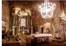
เหมืองเกลือวิลิชกา

** พักที่ Golden Tulip Krakow Hotel 4* หรือเทียบเท่า **