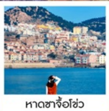
หาดซาจื่อฮั่ว