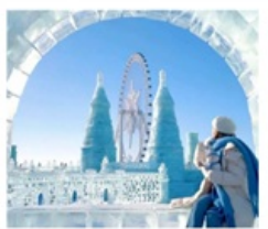
ICE & SNOW FEST.