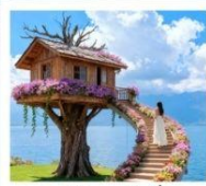
หมู่บ้านเหวินนီ