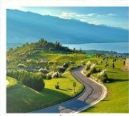
กุขาววินเซียงซาน