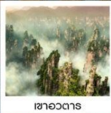
เซาอวตาร