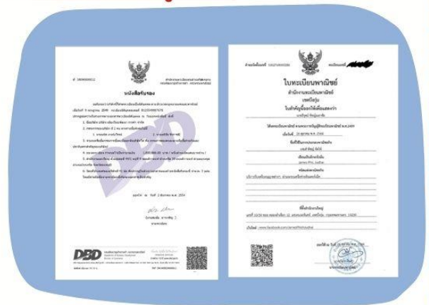
ตัวอย่างหนังสือจดทะเบียนบริษัท และ ใบทะเบียนพาณิชย์