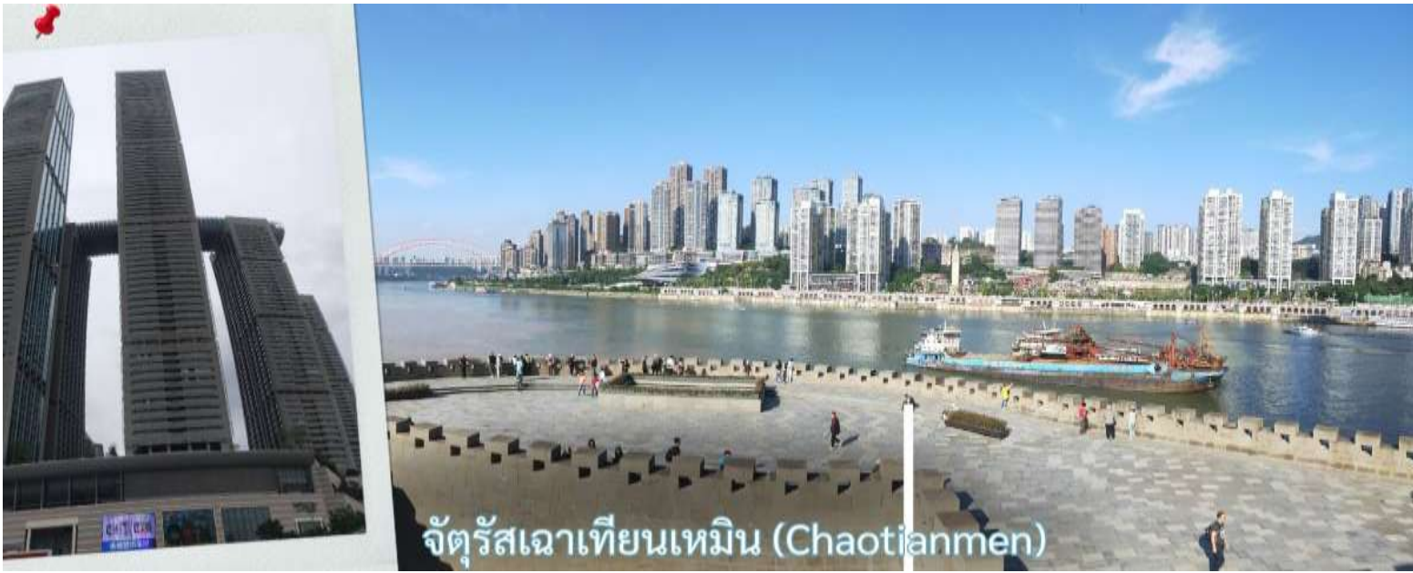
จัตุรัสเฉาเทียนเหมิน (Chaotianmen)

จุดบรรจบระหว่างแม่น้ำสองสาย โดยน้ำสีเหลืองของแม่น้ำแยงซีและน้ำสีเขียวมรกตของแม่น้ำเจียหลิงไหลมาบรรจบกันอย่างชัดเจน สร้างทัศนียภาพที่สวยงามและเป็นเอกลักษณ์ของฉงชิ่งอย่างแท้จริง