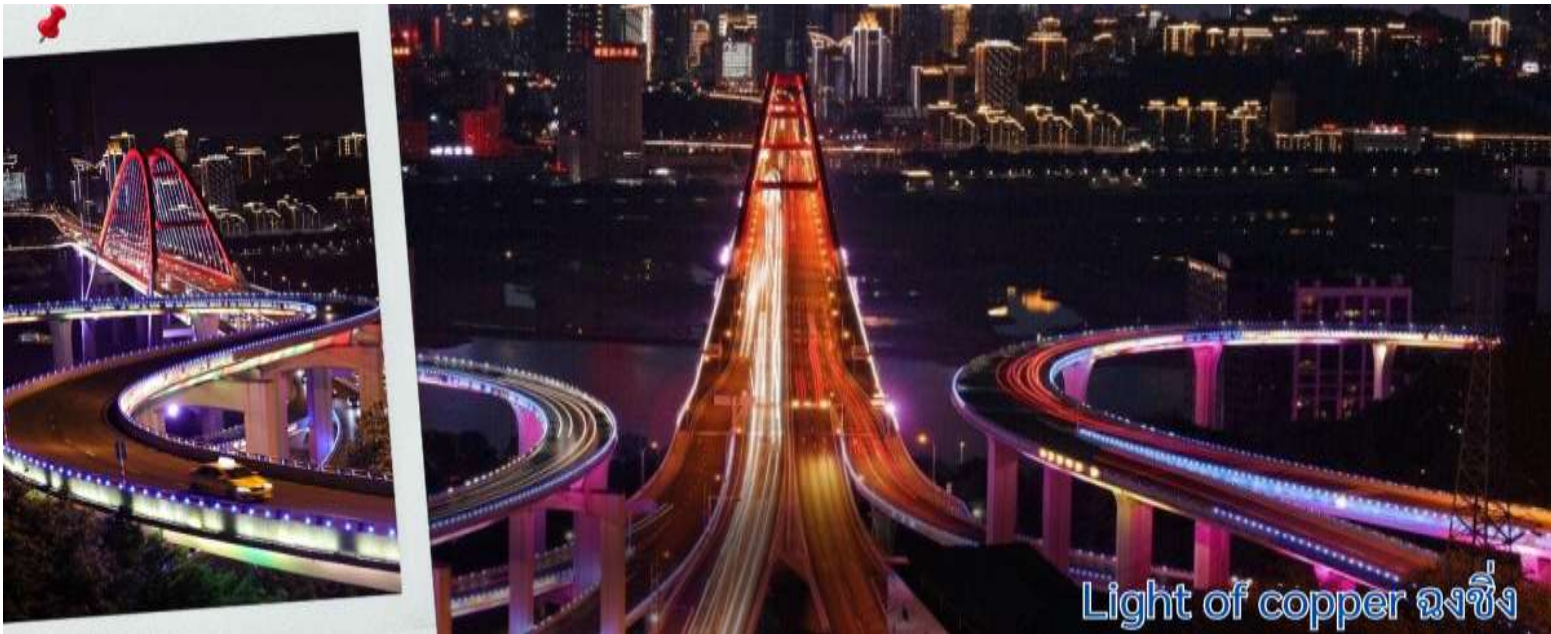
Light of copper ฉงชิ่ง

แนวถ่ายรูปวิวที่ Light of copper ฉงชิ่ง เป็นจุดชมวิวชื่อดังในมหานคร ฉงชิ่ง ประเทศจีน ซึ่งได้รับความนิยมอย่างมากในกลุ่มนักท่องเที่ยวและช่างภาพ จุดชมวิวทางยกระดับโดดเด่นด้วยทางเดินลอยฟ้าทรงกลมที่เชื่อมต่อกันสามารถมองเห็นวิวพาโนรามาของ สะพานซูเจียป่า (Sujiaba Interchange) ที่โค้งไปมาอย่างซับซ้อน และสะพานข้ามแม่น้ำแยงซีเกียง ไช่หยวนป่า (Caiyuanba Bridge) ท่ามกลางตึกสูงระฟ้าบรรยากาศยามค่ำคืน เมื่อเปิดไฟเมืองในช่วงค่ำจะเห็นแสงสีทองและสีทองแดงสะท้อนความงดงามของ "เมืองภูเขา" ได้อย่างชัดเจน