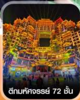
ตึกมหิศวรรษย์ 72 ชั้น