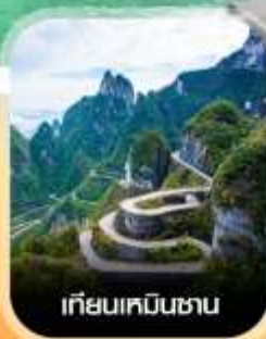
เกียมเคมินซาน