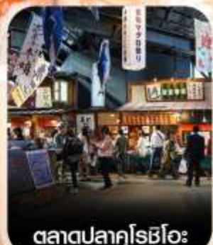
ตลาดปลาคุโรชิโอะ