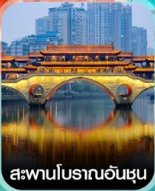
สะพานโบราณอันชุน