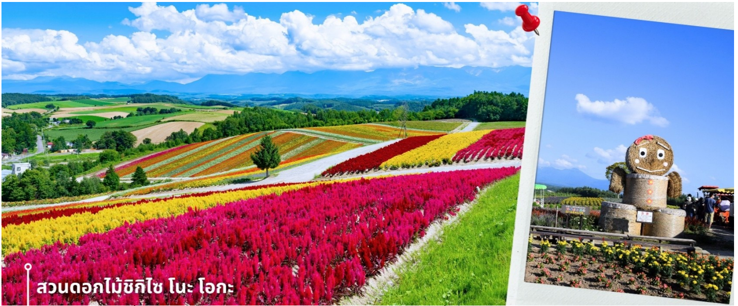
สวนดอกไม้ชิกิไซ โนะ โอะกะ

หลังรับประทานอาหารเช้า นำท่านเดินทางสู่ สวนดอกไม้ชิกิไซ โนะ โอะกะ ชื่อเต็มๆว่า Panoramic Flower Gardens Shikisai No Oka ซึ่งในช่วงซัมเมอร์จะเป็นเนินเขาสีแสนสดใสกว้างสุดสายตา พื้นที่กว่า 15 เฮกตาร์ หรือประมาณ 93 ไร่ เป็นสถานที่ที่ได้ชื่อว่า มีความสวยงามทั้ง 4 ฤดู ที่สวนแห่งนี้จะมีดอกไม้หลากหลายสายพันธุ์ ทั้ง ลาเวนเดอร์ ทิวลิป โคลเคีย ทานตะวัน และอื่นๆ มากกว่า 30 ชนิดที่สลับกันไปตามฤดูกาล อย่างในช่วงซัมเมอร์ คือ ช่วงเวลาที่ บรรดาดอกไม้และพืชพันธุ์จะบานสะพรั่งสุดสายตา พร้อมกับบรรยากาศอันสดใสรวมถึงกิจกรรมกลางแจ้งที่ท่านเพลิดเพลิน โดยแต่ละช่วงเวลาจะมีดอกไม้ประจำฤดูกาลบานต้อนรับในบรรยากาศสดชื่น และยังมีทิวเขาที่งดงามเป็นเหมือนฉากหลัง ให้ท่านได้อิสร่เดินชมความสวยงามและเก็บภาพความประทับใจ