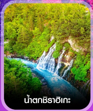
น้ำตกชิราอิเกะ