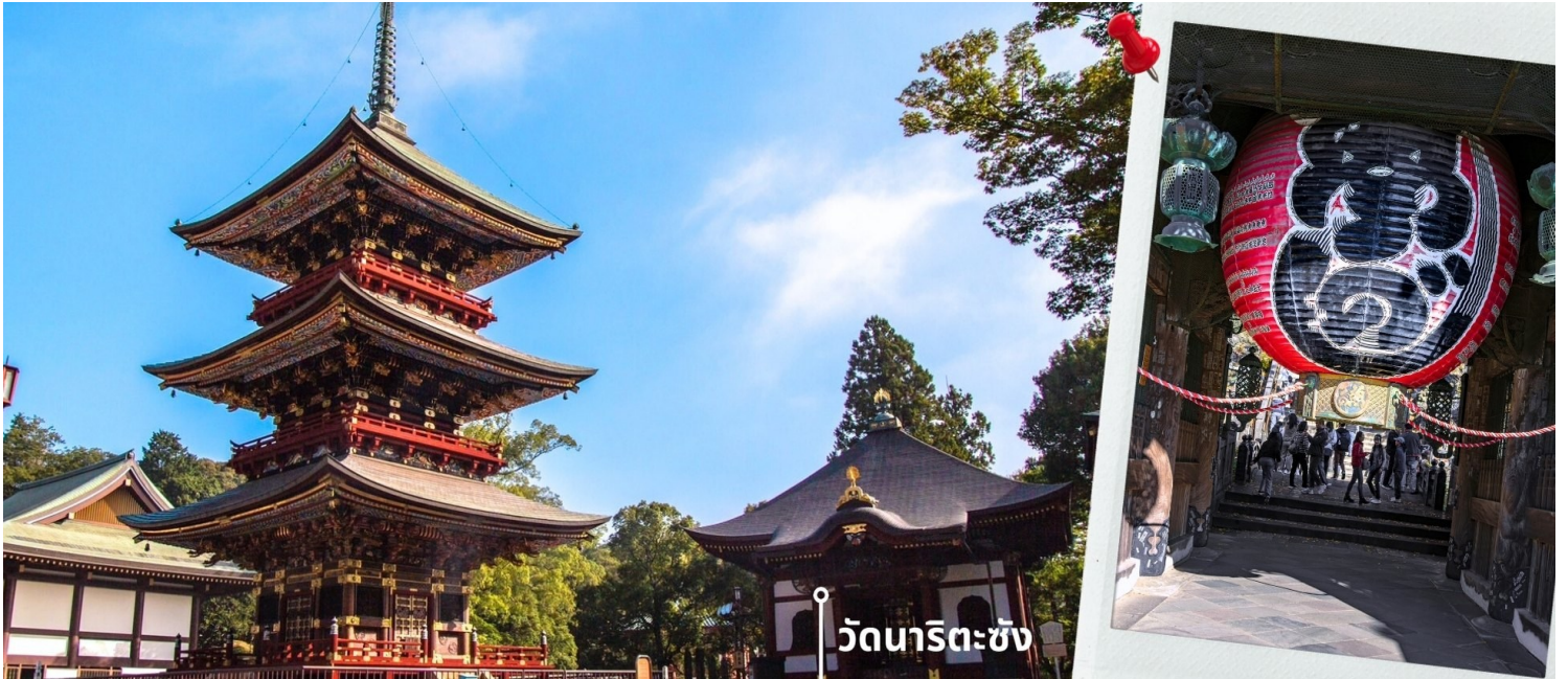
วัดนาริตะซัง

10.45 น. เดินทางถึงสนามบินนาริตะ ประเทศญี่ปุ่น หลังจากผ่านพิธีตรวจคนเข้าเมืองและศุลกากรแล้ว นำท่านขึ้นรถโค้ชปรับ เที่ยง อากาศ เดินทางออกจากสนามบิน เพื่อ นำท่านเดินทางรับประทานอาหารเที่ยง รับประทานอาหารเที่ยง ณ ภัตตาคาร (2) เมนูพิเศษ เซ็ตซาบู ซาบู สไตล์ญี่ปุ่น หลังรับประทานอาหารเที่ยง นำท่านไหว้พระขอพรที่ วัดนาริตะซัง ซินโซจิ Narita San Shinsho-ji เป็นวัด ศาสนาพุทธ ตั้งอยู่ที่ จังหวัดชิบะ (ใช้เวลาเดินทางประมาณ 30 นาที) เป็นวัดที่เก่าแก่ที่สุดแห่งหนึ่งในญี่ปุ่น มี โครงสร้าง รูปปั้น และสิ่งศักดิ์สิทธิ์ที่มีประวัติยาวนานหลายศตวรรษ สร้างขึ้น เพื่อบูชาอะคะระซึ่งเป็นเทพแห่งไฟ พิธีกรรมที่น่าสนใจที่สุดอย่างหนึ่งคือ พิธีสวดขอพรโกมะ ให้ท่านได้สักการะ องค์ฟูโดเมียวโอ หรือที่เรียกกันว่า “นาริตะฟูโด” ซึ่งประดิษฐานอยู่ในวัด เป็นองค์พระประธานหลักและเป็นศูนย์กลางที่พึ่งทางจิตใจของผู้คนที่ศรัทธา