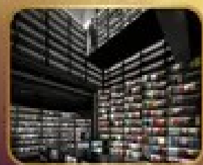
ชมร้านหนังสือ