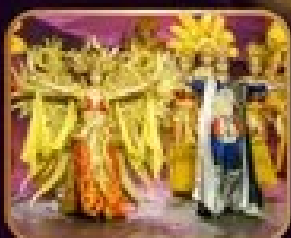
ชมสุดยอดโชว์ระบำการตา