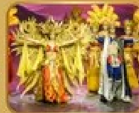
ชมการแสดงโขน