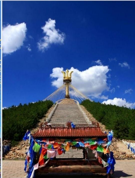
อี้เค่อโอบุ (Great Oboo, 伊克敖包)