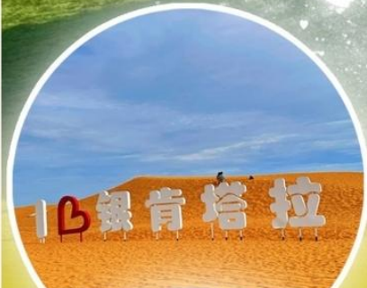
ทะเลทรายอินเคินทาลา