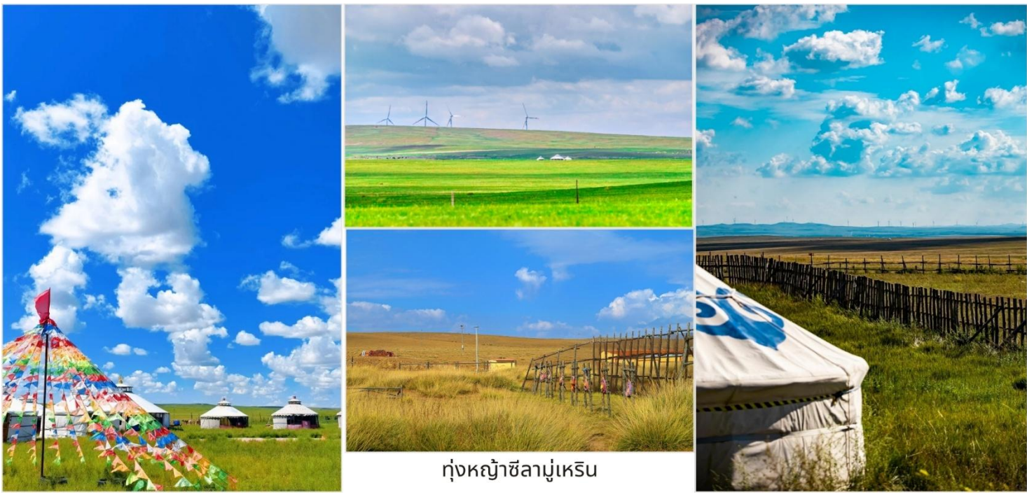
ทุ่งหญ้าซิลามูเหริน