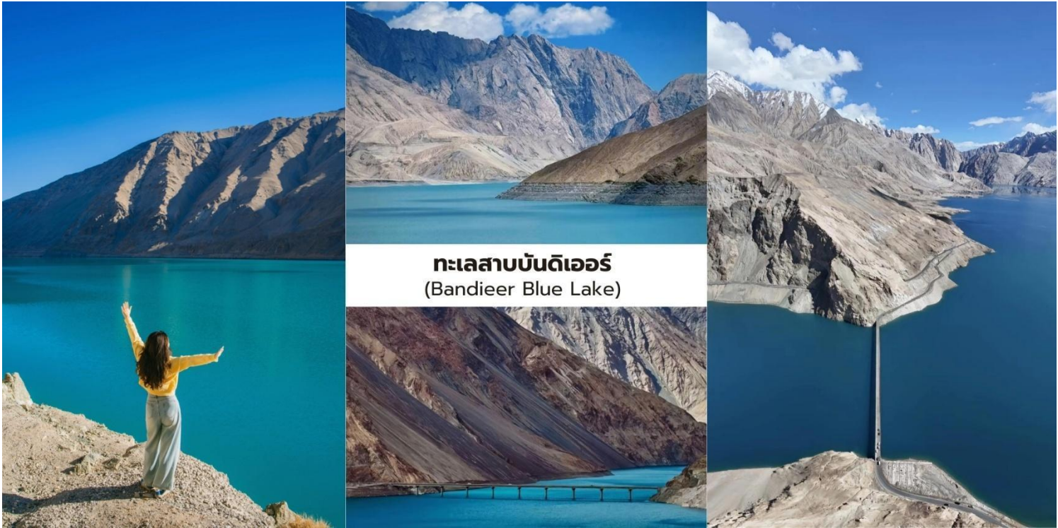
ทะเลสาบบันดิเออร์ (Bandieer Blue Lake)

จากนั้นนำท่านเปลี่ยนการเดินทางในช่วงนี้โดยใช้ รถยนต์ 7 ที่นั่ง ตามที่กำหนด เพื่อให้สามารถลัดเลาะไปตามเส้นทางภูเขาที่คดเคี้ยวได้อย่างสะดวกและปลอดภัย นับเป็นอีกหนึ่งประสบการณ์การเดินทางบนถนน ภูเขาที่มีเอกลักษณ์ที่สุดแห่งหนึ่งของเส้นทางท่องเที่ยวในซินเจียง