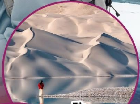
ทะเลสาบไป่ซาหู