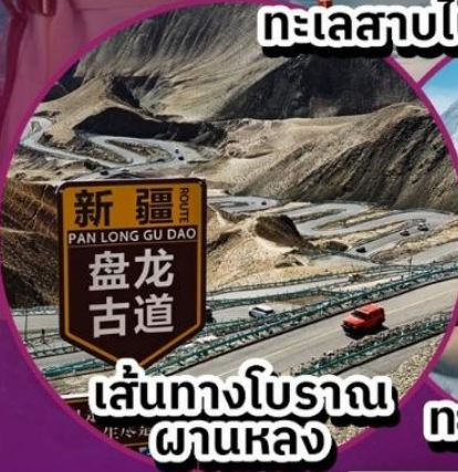
เส้นทางโบราณ ผานหลง