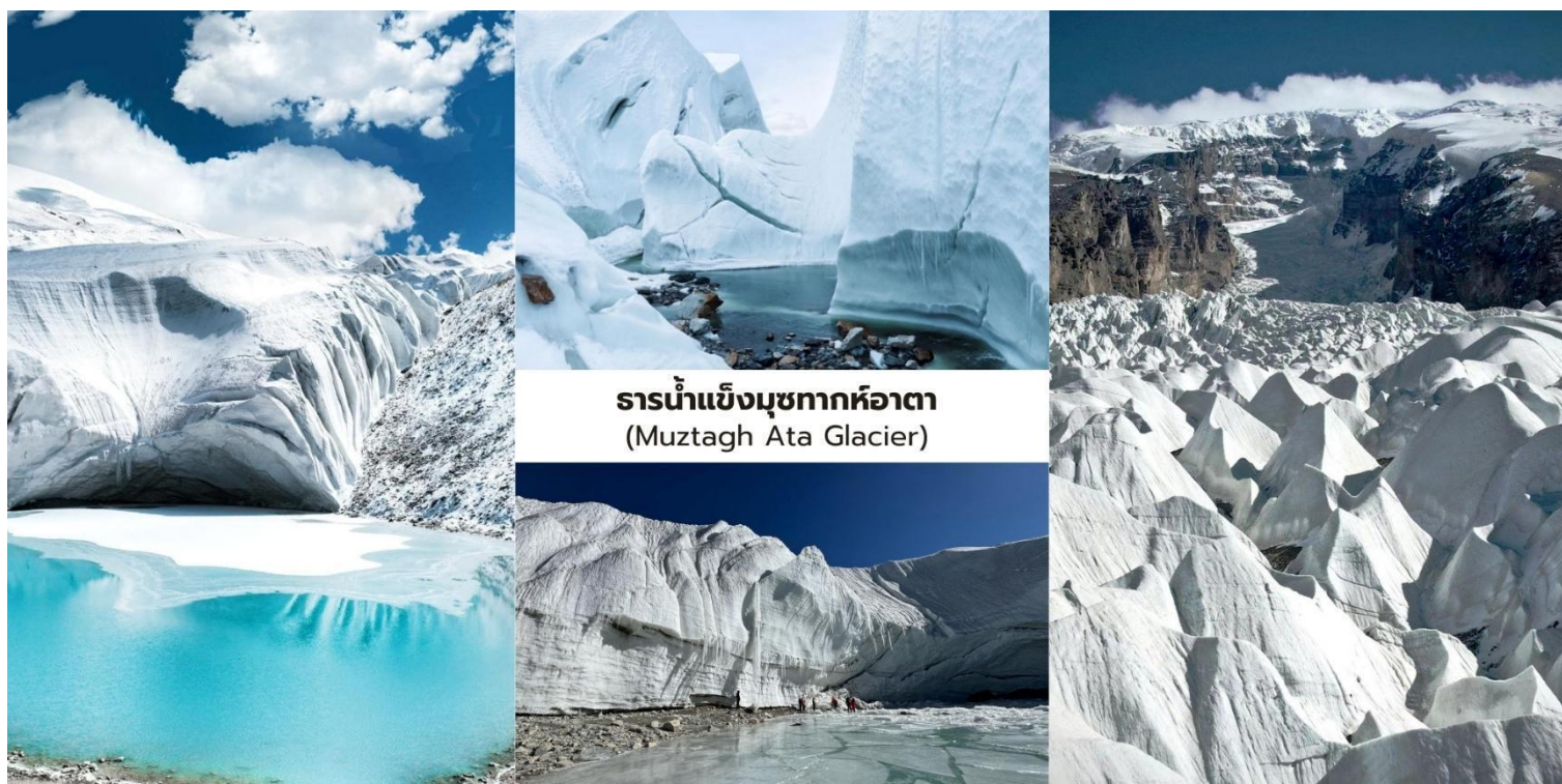
ธารน้ำแข็งมุขทากหืออาตา (Muztagh Ata Glacier)

นักท่องเที่ยวจะได้ โดยสารรถกอล์ฟไฟฟ้าของอุทยาน (รวมในรายการ) ลัดเลาะเข้าไปยังบริเวณเชิงเขาเพื่อชม ธารน้ำแข็งขนาดใหญ่ ที่ไหลลงมาจากยอดเขา ท่ามกลางทัศนียภาพของภูเขาหิมะและทุ่งน้ำแข็งที่ทอดยาวสุดสายตาให้ความรู้สึกถึงความยิ่งใหญ่ของธรรมชาติบนที่ราบสูงปามีร์ระหว่างทางอาจพบกับจามรี (Yak) ที่อาศัยอยู่ในพื้นที่ธรรมชาติของที่ราบสูงรวมถึงทิวทัศน์ภูเขาหิมะที่สวยงามเหมาะสำหรับการถ่ายภาพและชมธรรมชาติอันบริสุทธิ์