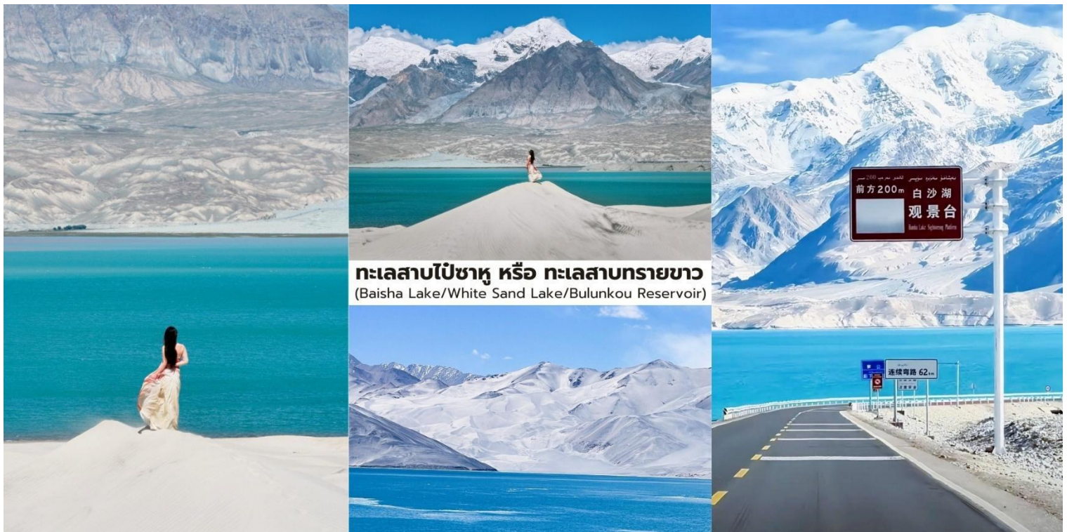
ทะเลสาบไปซาหู หรือ ทะเลสาบทรายขาว (Baisha Lake/White Sand Lake/Bulunkou Reservoir)

บ่าย นำท่านเที่ยวชม ทะเลสาบคาราคูล (Karakul Lake) ทะเลสาบธารน้ำแข็งขนาดใหญ่ ที่ตั้งอยู่บนความสูงประมาณ 3,600 กว่าเมตรเหนือระดับน้ำทะเล บริเวณเชิงเขา मुखากหืออาตาคำว่า "คาราคูล" ในภาษาเตอร์กหมายถึง "ทะเลสาบดำ" แต่ในวันที่อากาศแจ่มใสผืนน้ำของทะเลสาบจะปรากฏเป็น สีน้ำเงินคราม และทำหน้าที่เสมือน กระจกเงาธรรมชาติขนาดใหญ่ ที่สะท้อนภาพของภูเขาหิมะและท้องฟ้าออกอย่างสวยงามบริเวณรอบทะเลสาบเป็นถิ่นอาศัยของ ชนเผ่าคีร์กีซ ที่อาศัยอยู่ในบ้านแบบ ยูร์ต (Yurt) ซึ่งเป็นที่พักแบบดั้งเดิมของ ชนเผ่าเร่ร่อนในเอเชียกลาง นักท่องเที่ยวสามารถเดินชมทัศนียภาพรอบทะเลสาบและสัมผัสบรรยากาศธรรมชาติของที่ราบสูงปามีร์ที่เจียบสงบถือเป็นหนึ่งในจุดชมวิวกุเขาหิมะและทะเลสาบที่สวยงามที่สุดของเส้นทางสายปามีร์