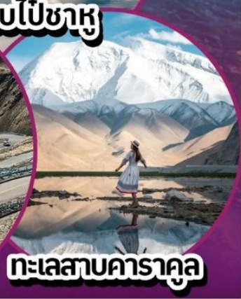
ทะเลสาบคาราคูล