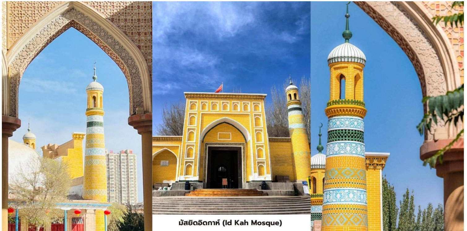
มัสยิดอิตก้าห์ (Id Kah Mosque)

สมควรแก่เวลานำท่านเดินทางสู่สนามบินคัชการ์ (Kashgar Airport) ภายในประเทศสู่เมืองหลานโจว