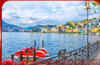
เมืองตากอากาศ ลูการ์โน