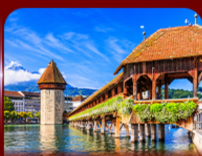
สะพานไม้ชาเปล ลูซิริน